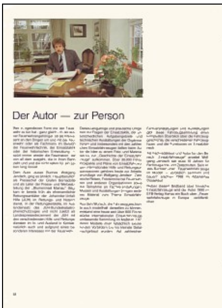
Nachwort zur Person des Autors (Abbildung Musterseite)

Neben diesem Bildband über finnische Einsatzfahrzeuge wird der Autor 1990 im EFB-Verlag Hanau ein Buch über „Feuerwehrfahrzeuge in Europa“ veröffentlichen.